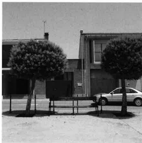
Vegetación arbórea en el parque del Ábaco.

- Se encuentran carencias en el tratamiento de varias plantaciones arbóreas que, por la poda que se les realiza, pierden las cualidades de generar sombra y aclimatar los espacios, como en el parque del Ábaco o diversas calles.