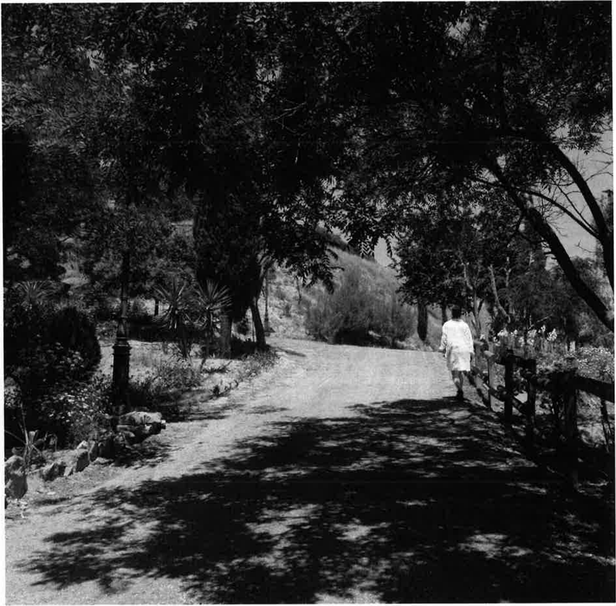
Zona ajardinada de gran valor, cuidada por vecinas y vecinos en Costaneta y la zona trasera de la Iglesia..