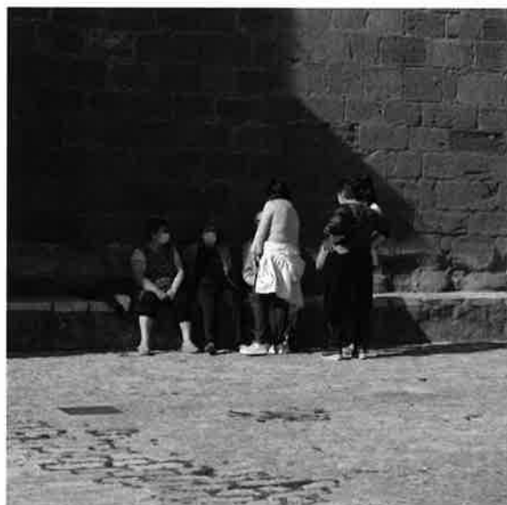
Banco corrido en fachada sur de la Iglesia a la sombra.