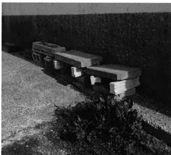
Bancos en la zona de la parte baja de Costaneta.

Los bancos suponen la unidad mínima de cuidado en el espacio público, se trata de un elemento que democratiza la calle y permite su disfrute por todas las personas. El uso de los espacios públicos depende de la existencia de lugares para sentarse, equipamientos urbanos adecuados a la funcionalidad de los espacios y el abastecimiento de servicios urbanos mínimos. Estos elementos son tan diversos como las necesidades que cubren y deben ser accesibles y adecuados para las personas mayores o personas con movilidad reducida. Se debe atender a la posición, altura, idoneidad de los materiales y ergonomía en bancos, contenedores, fuentes, etc.