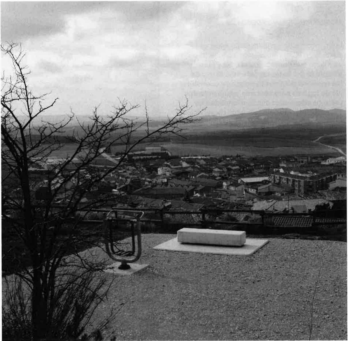
Espacio habilitado con mobiliario en el parque del Castillo.