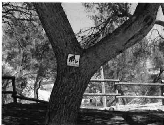
Cartel de concienciación en Costaneta.

Es importante atender a la existencia de papeleras y contenedores de características adecuadas y distribuidos de manera homogénea en el conjunto del espacio público del núcleo urbano. La falta de limpieza, mantenimiento o incorrecta localización de estos equipamientos pueden generar acumulación de basura, malos olores o una sensación profundamente desagradable del entorno.