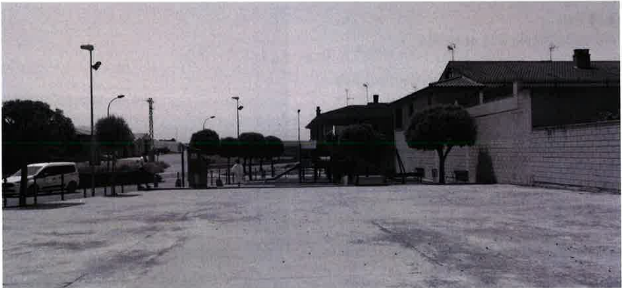
Parque del Abaco, popular entre vecinas y vecinos pero sin elementos de protección frente al clima, excesivo solcamiento, lluvia etc.