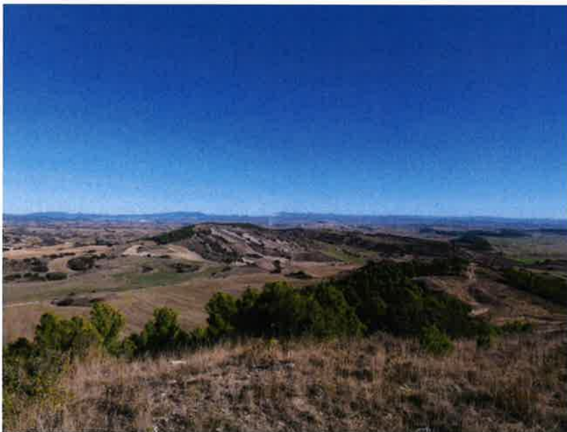
Fig. 4. Vista de Larraga desde uno de los altos de San Marcos.