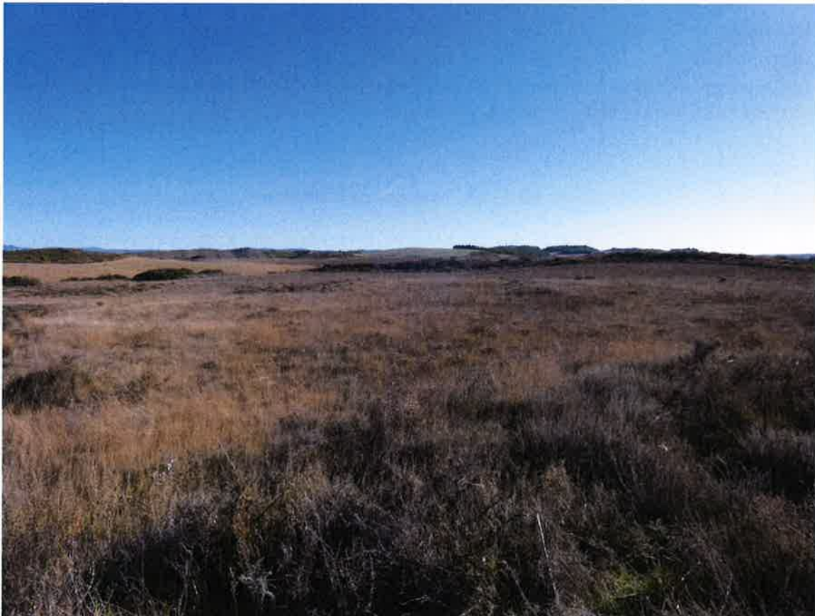
Fig. 3. Yacimiento de El Castellón.