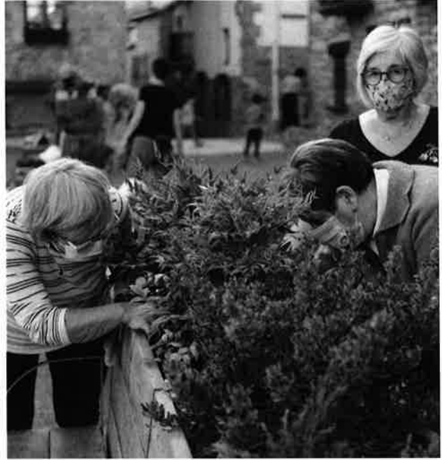
Proyecto de remodelación de la "Plaza de Abajo".