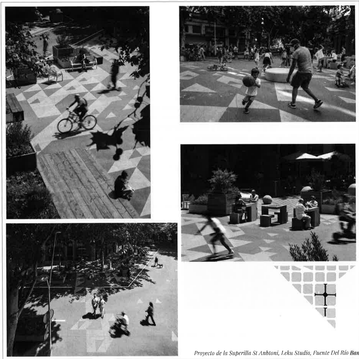
Proyecto de la Superilla St Anbtoni, Leku Studio, Fuente Del Río Bani