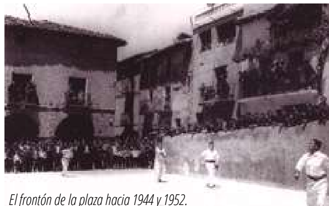
El frontón de la plaza hacia 1944 y 1952.